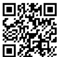
เอกสารประกอบการสมัคร