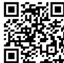
แบบฟอร์มสมัคร